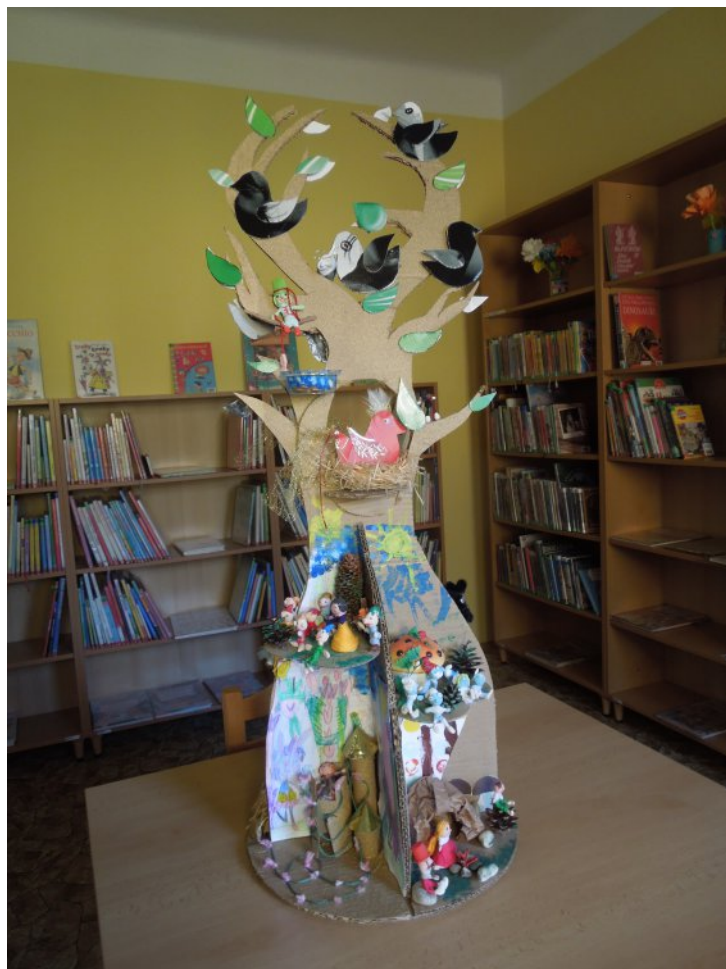
Pohádkovník z Lověšic se umístil na zaslouženém prvním místě!

Dcera s vnučkou připravily hlavičky a drátěnou kostru postav. Původně měly být hlavičky z bílé tuhnoucí hmoty, jenže ta po zaschnutí vykazovala vlastnosti sádry - drobila se a hlavičky postaviček by nepřežily žádnou další manipulaci. Hlavy z další tuhnoucí hmoty tělové barvy se přes noc změnilly v bez tvarové hroudy. Konečně až po smíchání obou tvarovacích hmot byl výsledek uspokojivý. Jelikož si děvčata v knihovně příliš nerozuměla s jehlou, oblékali jsme hotové postavičky pomocí vlny a lepením nastříhaných oděvů.