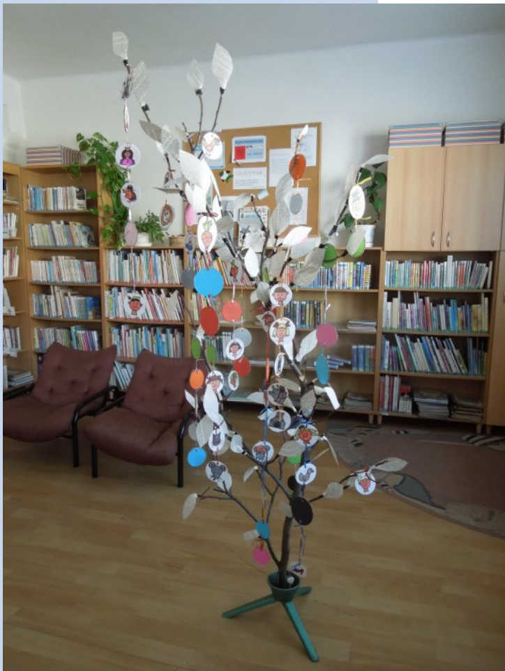
Krásné druhé místo patří stromu v Dluhonicích.

V Kozlovicích se v oddělení pro děti rozrostl pohádkový strom skoro až ke stropu. Ti, kteří nejsou spokojeni se svýmnosem, si mohou utrhnout sladkost z větve Frňákovníku, zatímco z hroudy hlíny na nás vykukuje zvědavý Krteček a na všechno dohlíží černovlasá Maková panenka s elegantním motýlem Emanuelem. V Dluhonicích zase na stromě vyrašily lístky plné písmenek.