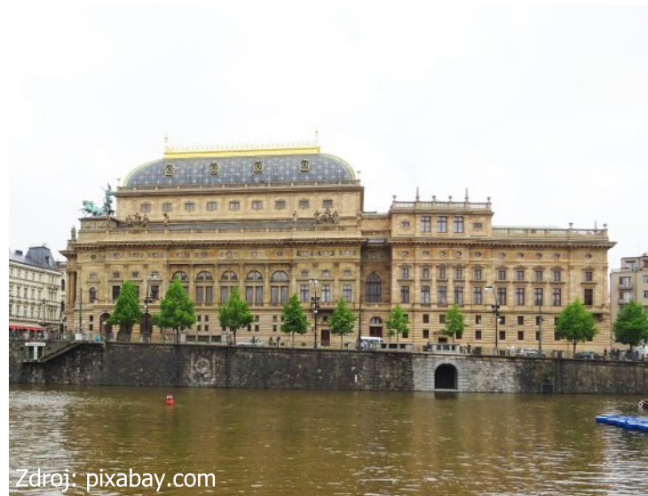
Národní divadlo je jednou z dominant Prahy.

15. První ročník legendárního hudebního festivalu, konajícího se ve Spojených státech amerických jihozápadně od stejnojmenného městečka, proběhl od pátku 15. srpna do pondělí 18. srpna 1969. Byl považován za jeden z největších a klíčových okamžiků v historii populární hudby. Festivalu se zúčastnilo mnoho legendárních umělců a kapel jako Jimi Hendrix, Janis Joplin, Jefferson Airplane, The Who, Carlos Santana nebo Country Joe and the Fish. Festival se také zapsal jako protest hippies proti válce ve Vietnamu a proti konzervativním hodnotám života. Znáte název festivalu?