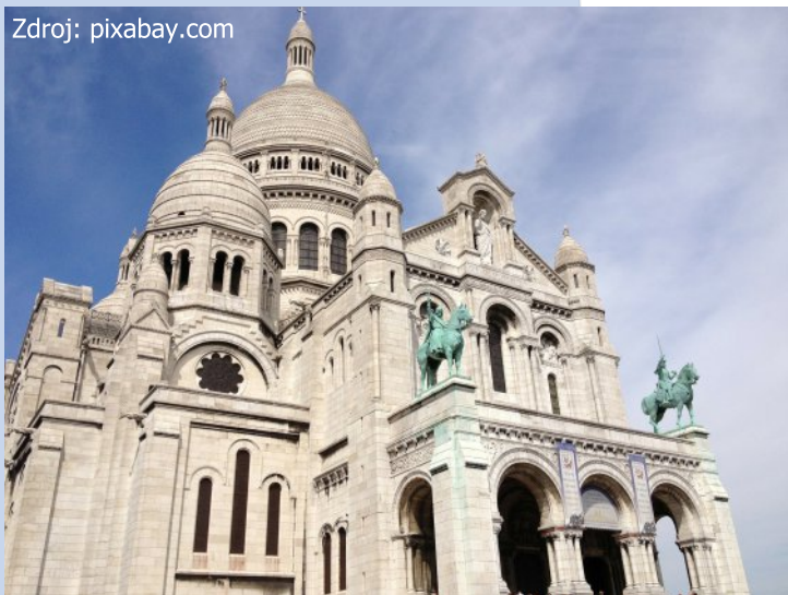
Bazilika Sacré-Coeur mi vždy připomene mé pařížské dobrodružství.

Z pozice nejmladšího jedince našeho cestovatelského trojlístku jsem ještě zaběhla zpátky k autobusu pro zapomenutou kabelku a jako typický turista se vydala k místu shledání. Abych si zkrátila cestu, rozhodla jsem se přeskočit zábradlí. Teprve nyní jsem uviděla, co se děje. V kleci na nějakém vozíku byl zavřený chlapík a cosi křičel a máchal rukama. Někteří příznivci se mu klaněli, jiní mu zřejmě chtěli dát pořádně na frak. Z postranních uliček už se k nám hnali ozbrojenci i hábitníci a všichni křičeli a začali se bít hlava nehlava, zatímco já stále trčela na své vyhlídce na zábradlí. Najednou se nějaký chlap rozběhl přímo ke mně s tyčí v ruce a já v tu chvíli ležela na zádech přímo mezi