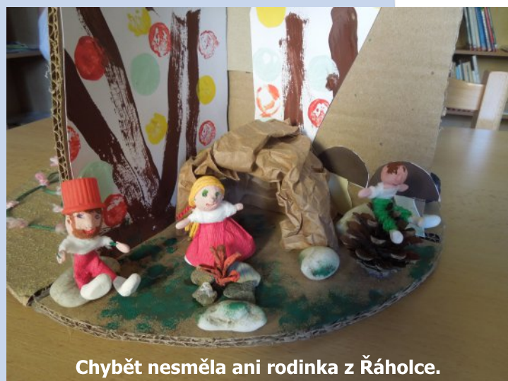
Chybět nesměla ani rodinka z Řáholce.

Velký dík patří zejména třem sourozencům ve věku od tří do osmi let, kteří do knihovny chodili spolu s babičkou skoro každý půjčovný den a díky kterým strom značně povyrostil. Svým malým výtvarníkům pomáhala s prací na Pohádkovníku ještě jedna babička a dvě maminky. Když velcí kluci nepřišli, aby nám nastříkali barvami hrady, statečně se nabídl šestiletý kutil. Většina barvy skutečně skončila opravdu na hradech, nikoli na všech okolo. Povzbuzen úspěchem chtěl mladý Picasso rovnou přestříkat i své kolo.