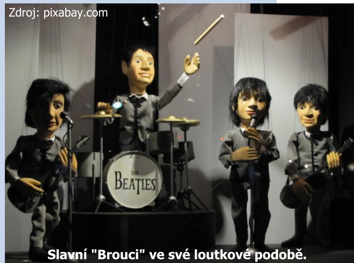
Slavní "Brouci" ve své loutkové podobě.

4. Tarja Turunen je finská zpěvačka, známá především ze svého působení v kapele Nightwish. Pro svůj zpěv je právoplatně nazývána Ledovou královnou severu anebo také Bohyní metalu. Jak zní celé jméno Tarji Turunen?