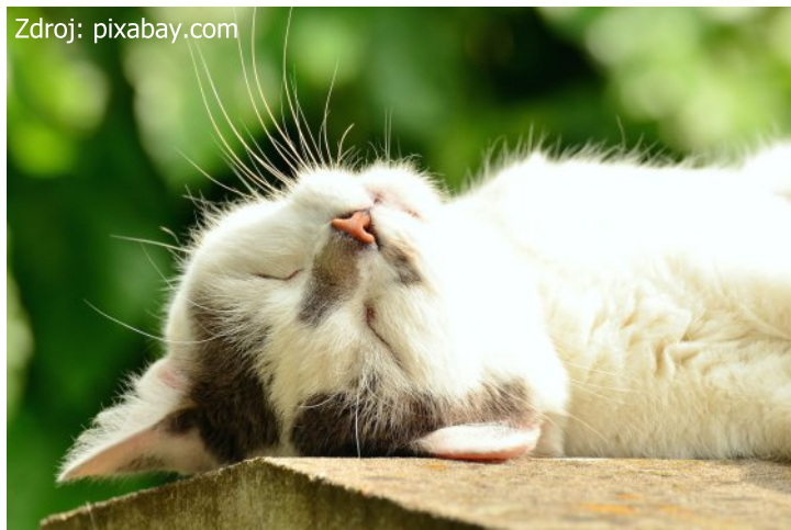
Není nad božský klid uprostřed zahrádky!