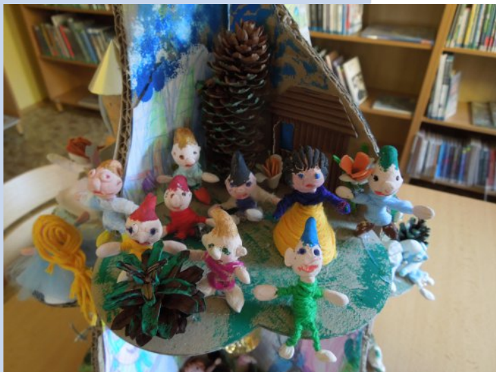
Na lověšickém Pohádkovníku patří ke Sněhurce hned osm trpaslíků!

S důvěrou v šikovné děti z Lověšic jsem přihlásila naši knihovnu do soutěže o nejhezčí strom „Pohádkovník“. Děti se do tvoření zpočátku pustily s velkým nadšením, ale úměrně k trvání veder a finiši ve škole jejich návštěvy řídly. Naštěstí první velké skupiny zvládly vytvořit podstatnou část velkolepého díla a malí vytrvalci pak strom dopěstovali do konečné podoby.