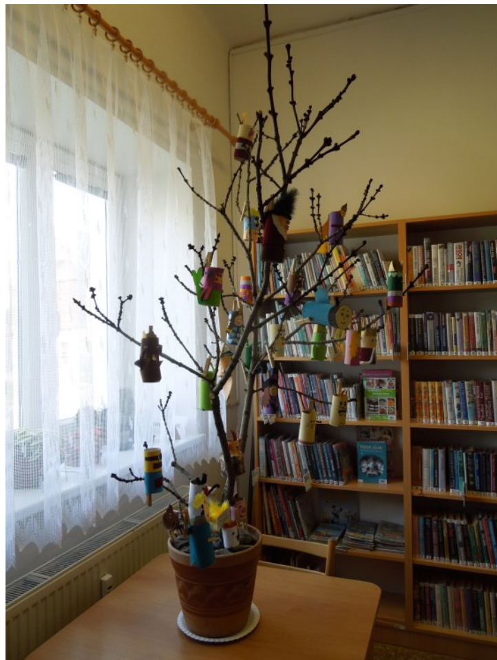
Čekyňský Pohádkovník, který si vysloužil třetí místo.

Jak asi již tušíte, vybrat ten nejkrásnější strom bylo opravdu velice těžké. Hodnotili jsme především nápad, originalitu a náročnost. První místo v soutěži proto zaslouženě získala knihovna v Lověšicích, na druhém místě se umístila se svým stromem knihovna v Dluhonicích a třetí místo patří knihovně v Čekyni. Oceněné knihovny získaly na památku diplom, pro své čtenáře hodnotné deskové hry a do všech zúčastněných knihoven putovala sladká odměna pro všechny, kteří přiložili své šikovné ruce k dílu.