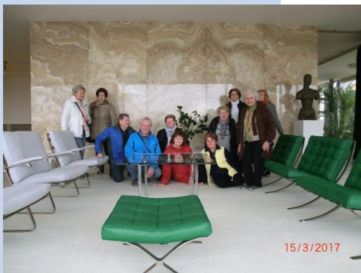
Část přerovské výpravy před onyxovou stěnou v obývacím pokoji.