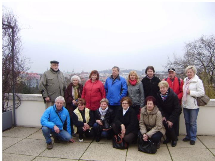
Studenti VU3V na terase vily Tugendhat.

Samotná vila pak žila svým dalším životem a nebyla ušetřena neblahých stavebních zásahů, když se stala majetkem Německé říše. Největší devastaci však prodělala při osvobození Brna sovětskou armádou, kdy se stala ubytovnou, a dokonce i stájí pro jezdecký oddíl maršála Malinovského. Po osvobození pak plnila funkci soukromé taneční školy i rehabilitačního střediska a v dalších letech procházela postupnými rekonstrukcemi. V roce 1994 byla vila Tugendhat převedena pod správu Muzea města Brna, které ji zpřístupnilo veřejnosti jako instalovanou památku moderní architektury.