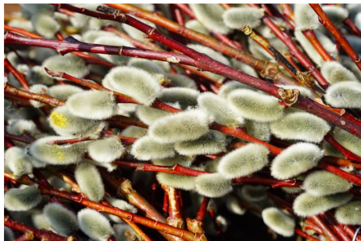
Svěcené kočičky měly pomáhat proti pohromám, zlým kouzlům i nemocem.

Šestá neděle postní („Květná“) – tímto dnem se připomíná vjezd Krista do Jeruzaléma, kde rostou svěcené palmy – ty v našich krajích nahradily větvičky jívy (tzv. kočičky), kterým byla připisována zázračná moc. Zastrkovaly se proto za rámy svatých obrazů a kříže nebo se zapichovaly na kraj pole, aby ochránily úrodu.