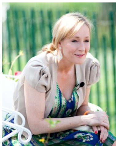
Joanne Rowlingová