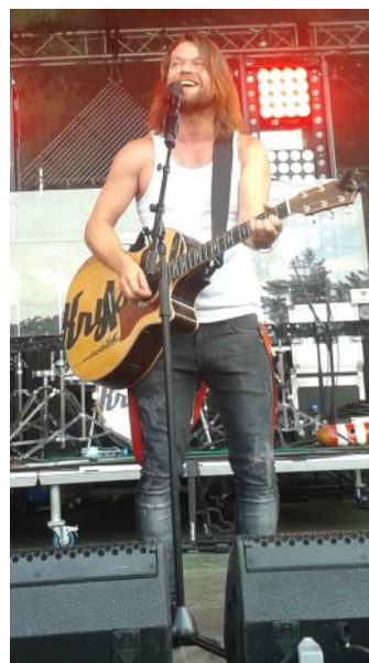
Richard Krajčo

15. Loňské prázdniny patřily bezpochyby skupině Kryštof. Přestože jejich epická balada Ty a já není klasický letní hit, její videoklip zhlédlo více než 2 miliony diváků. VÍTE, NA KTERÉ JEJICH DESCE MŮŽETE TUTO OBLÍBENOU SKLADBU NAJÍT?