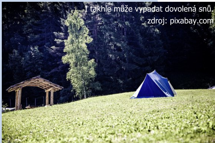
I takhle může vypadat dovolená snů.

• "Ideální dovolená - to je místo, kde jsem nikdy nebyla, kde se dá poznávat okolí v sedle kola bez použití převodů, kde se dá hodit batoh na záda a na celý den se ztratit, toulat se přírodou a potkat se nanejvýš s lesní zvěří. Je to místo, kde teče řeka, u které se dají prosedět dlouhé hodiny a jen se tak dívat a být. Je to také vítr ve vlasech, zpěv ptáků při ranní kávě a večerní zapadající slunce. Je to dobrá knížka do pohodlné postele po dni nabitém prožitky, je to záře ohně na pozadí oblohy plné hvězd. A konečně je to i přítel, který toleruje tohle romantické třeštění."