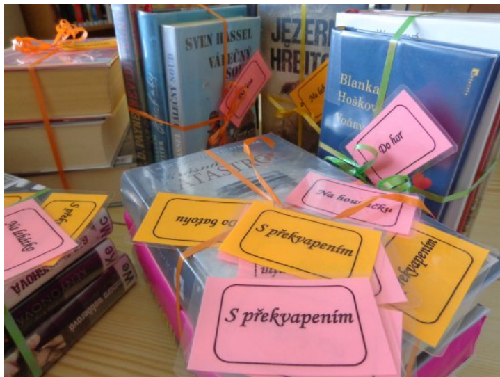
Knižní balíčky právě dostávají svoji podobu.

Pro ty z vás, kteří máte rádi knižní překvapení, jsme připravili také speciální balíček, ve kterém naleznete jednu ze tří knih zabalenou. Její název a obsah tak odhalíte až po vypůjčení.