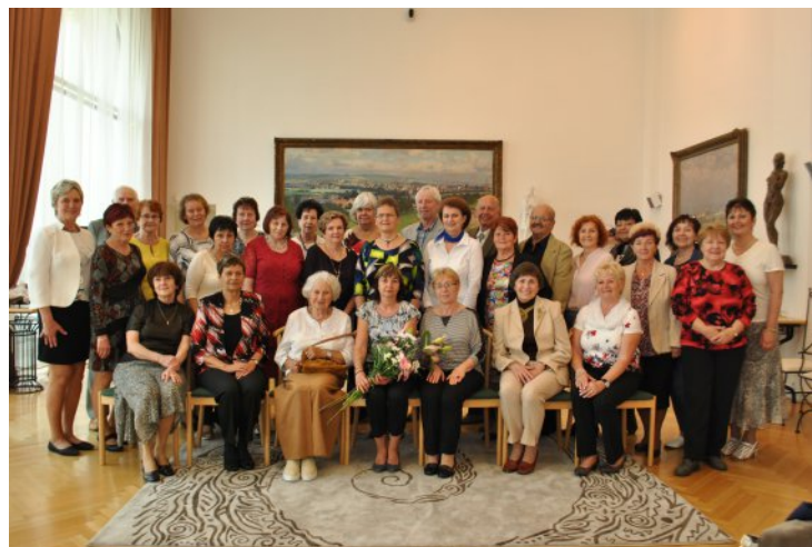
Ukončení semestru Genealogie 24. 5. 2016 v Mervartově síni Muzea Komenského v Přerově