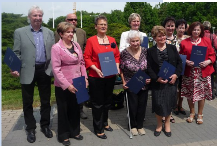
Studenti VU3V po slavnostní promoci v Praze