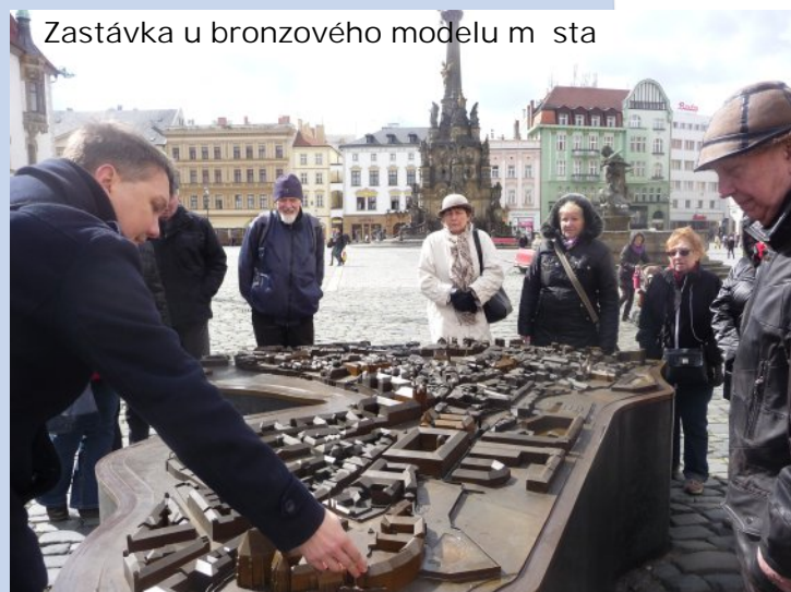
Zastávka u bronzového modelu m sta

T ináct state ných neodradilo ani prom nivé po así, které si s námi na Apríla skute n p kn pohrálo. Procházku jsme zahájili v místech, kde byl v roce 1306 zavražd n poslední P emyslovec Václav III., tedy na olomouckém Václavském nám stí, na n mž stojí významná katedrála sv. Václava. V Arcidiecézním muzeu jsme si prohlédli trezorovou klenotnici s monstrancemi, relikviá i a dalšími liturgickými p edm ty, která je vybudována v nedobytné hradní v ži. Dominantou této sbírky je barokní monstrance zvaná Zlaté slunce, která je osázena tém 1500 diamanty a váží více než 3,5 kilogramu. Mimo biskupského barokního ko áru a dalších památek z období baroka jsme obdivovali také dílo sv toznámého socha e Ivana Theimera, autora olomoucké Arionovy kašny, od n jž pochází také sochy na p erovské kašn u Hané. Z oken muzea jsme m li krásný výhled na barokní klášter Hradisko, který jsme si prozatím prohlédli alespo na dálku, ale možná se stane cílem našeho dalšího výletu.