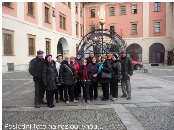
Poslední foto na rozlou enou...